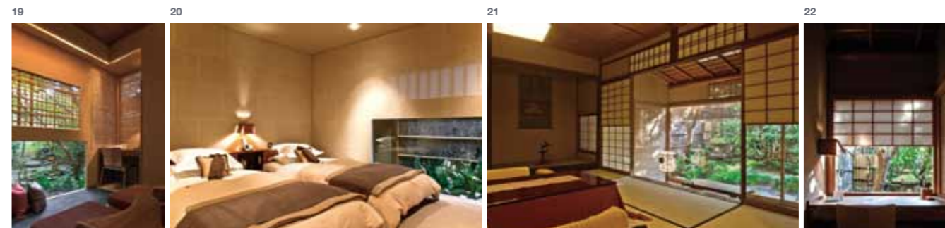
18—客室・晩翠:大開口によって、青竹の庭は一幅の絵のようだ。また、建具をすべて開け放つことが可能。内と外の境界がなくなると、より開放的な室内になる 19—自然と腰を下ろしたくなるスペース。床をスキップさせ、さりげなく空間を分けている 20—ベッドルーム:韓紙張りの壁に照明がほんのり反射し、穏やかな眠りにつけることは想像に難くない。開口を下に配して直射光を防ぎ、心地良い目覚めを確保。ブラインドは電動式で至れり尽くせり 21—客室・翠:シンプルにまとめられた客室だが、大開口のフィクスガラスを設け、内と外を一体的にデザインするという「俵屋旅館」の真髓が潜む。緑側の奥には書斎が隠れている 22—書斎:約1畳の空間にあるのは椅子と机だけ。ピクチャーウィンドウ越しの庭の風景を独り占めできる贅沢さはたまらない、と人気がある