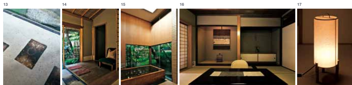
12—客室・泉:「俵屋旅館」の中で最も古い客室で、2006年にリノベーションされた。ガラスが入っているとは思えない開放的な空間。うっかりそのまま庭に出ようとする人もいるとか。ガラスは毎日、丹念に男衆が磨いている。左に置かれた李朝のバングチは、当主が一目惚れして購入したもの | 13—土間の三和土に埋め込まれた陶板:主張せず、周囲に馴染んでいる風合いが絶妙 14—土間脇のスペース:それぞれの客室には、自分の居場所的なスペースが設けられている。椅子に座りながらポーツと庭を眺める時間は絶品 15—湯船に浸かった時の庭との関係を第一に考え、デザインされた。浴槽は、ヒノキよりも耐水性・耐湿性に優れたコウヤマキを使用。温度が下がりにくく、何といっても、お湯がなめらかだとか… 16—柱以外はすべて解体し、木材を再利用してリノベーションしている。電話やテレビなどは目につかない場所に収め、非日常空間を演出 | 17—当主自らデザインした行灯:洗練された美しさが漂っている