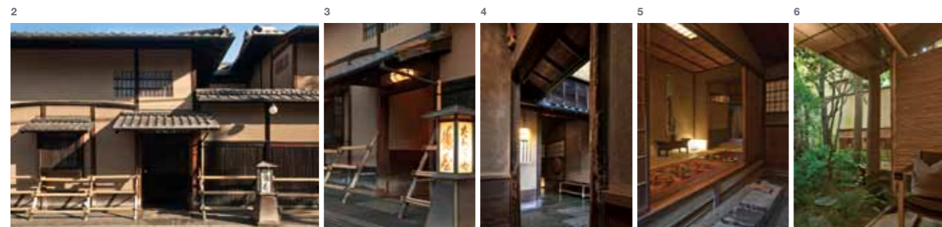
1—改修・増築を繰り返しているため、内部は巣穴のように入り組んでいる。客室はどれも入り隅にあり、その途中に坪庭やギャラリースペースが設けられている。右の餅花は、12月上旬、正月飾りのためにスタッフ総出でつくられた 2,3,4,5—寸法が絶妙で、当主に「聖域だ」と言わしめる玄関。唯一、手を加えていない場所。暖簾をくぐり、通り庭を過ぎると季節や行事に応じて室礼が変わる玄関土間に迎えられる。奥には、光と風、緑に満ちた豊かな空間が広がっている… 6—「庭座」と呼ばれるスペース：内部にまで緑を取り囲んでいて、庭を見ながらゆったりとくつろぐことができる。物思いにふけるにはとっておきの場所